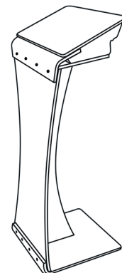
• Totem (vendido separadamente)